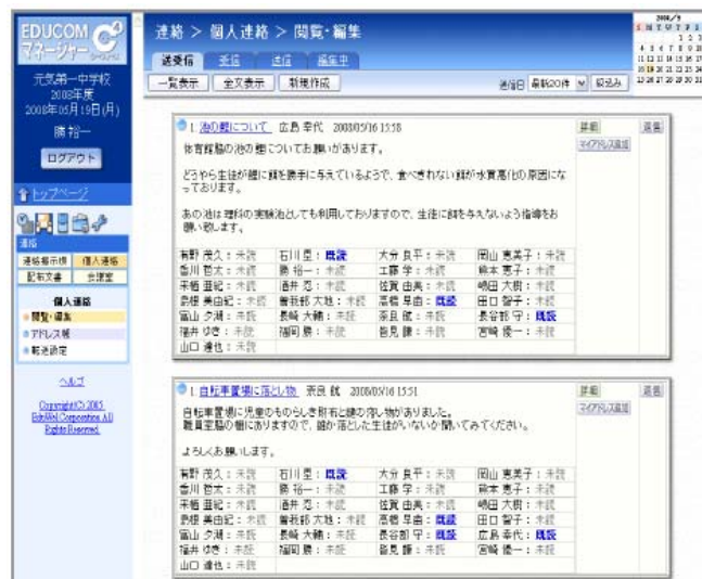
個人連絡イメージ図