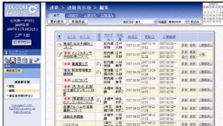
連絡掲示板 イメージ図