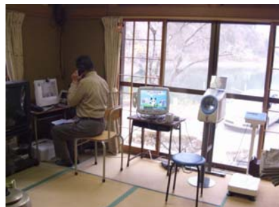
奥多摩町 生活館における運用状況