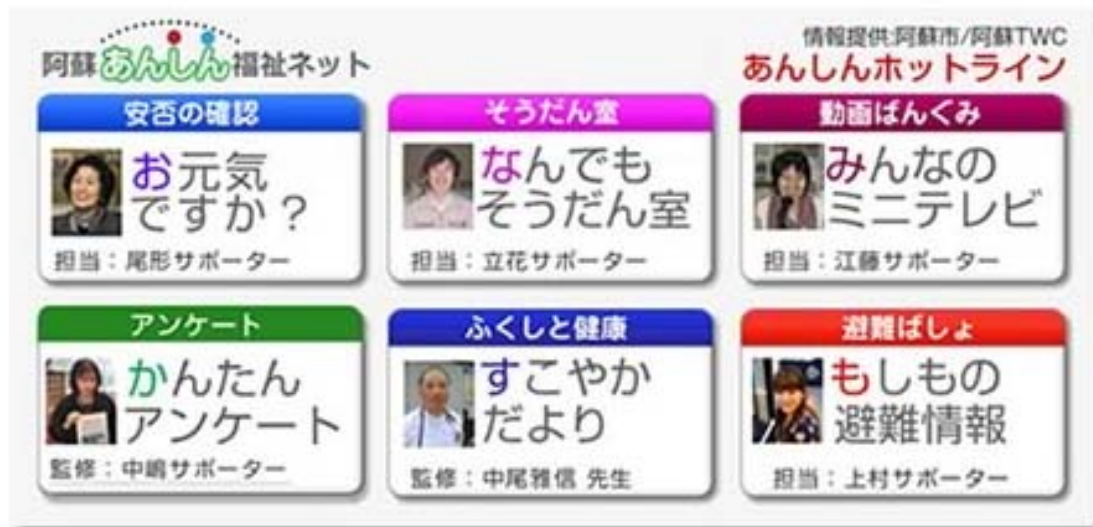
図2. 阿蘇あんしん福祉ネット画面