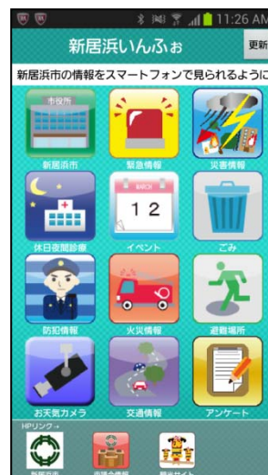
スマートフォン画面