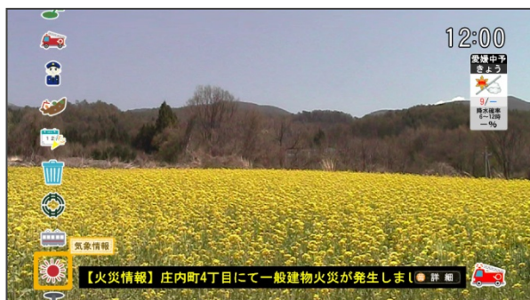
データ放送画面例

データ放送のコンテンツは、新居浜市役所のホームページや緊急メールと連動しており、ホームページ内容の更新や緊急メールが配信されれば、データ放送のコンテンツも自動で更新されるしくみとなっているため、情報の入力や管理が一元化されている。また、データ放送のアイコンをアプリ型デザインにしたのは、当初からスマートフォン向けに情報配信することを見据えたもので、ケーブルテレビの加入者のみならず、多くの市民が行政情報等を容易にリアルタイムで取得できることを目的としている。