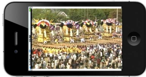
IP配信イベント中継