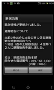
プッシュ通知画面

アプリを起動させた際に最新データを端末に保存するため、通信が途切れた際でも、保存した時点での情報が確認できる。