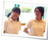
↑この二人が 仕掛け人!!