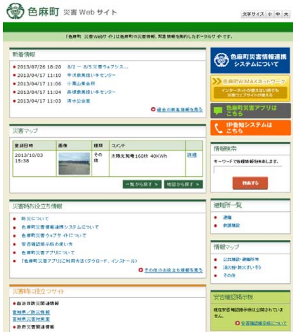
図2. 色麻町Web サイト

「色麻町 災害Web サイト」は色麻町の災害情報、緊急情報を集約したポータルサイトです。