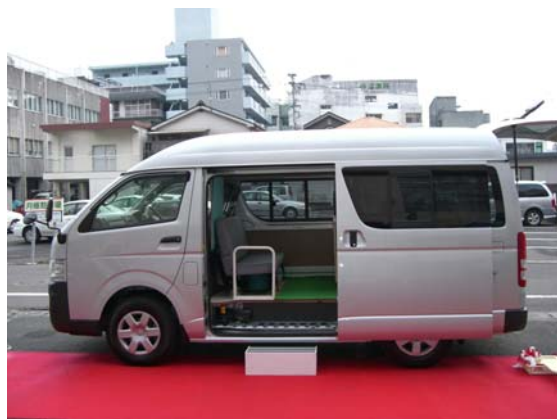
■下館地域で導入した巡回移動連絡車の外観

(問い合わせ先) 薩摩川内市役所 市民課 住民グループ TEL 代表 0996 (23) 5111 Eメール jumin@city.satsumasendai.lg.jp