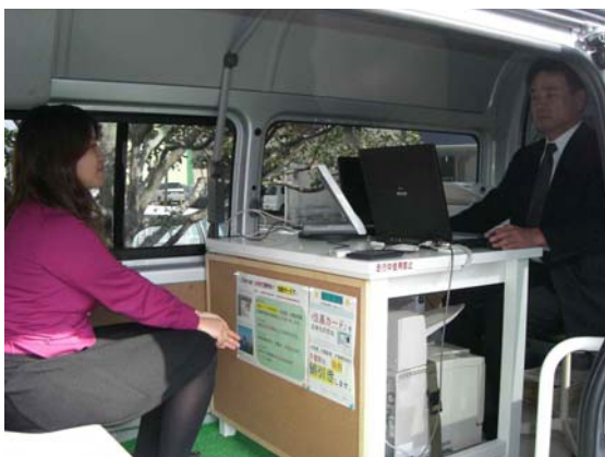
■車内では、職員が専用端末とプリンタを使って証明書を発行