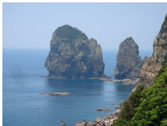
自然豊かな甌島のナポレオン岩