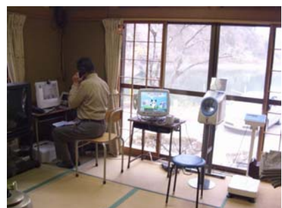
奥多摩町 生活館における運用状況