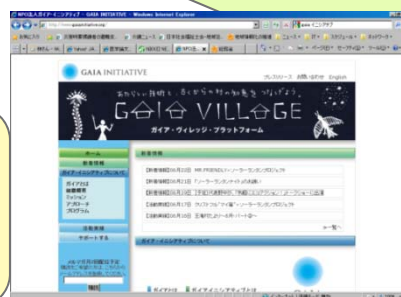
コミュニケーションサイト