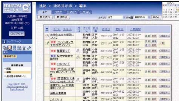
連絡掲示板 イメージ図

・今後の課題としましては、多くの自治体でこのソフトの提供を受け、クラウドの特徴である低料金での導入を行っていく方がベターだと思います。