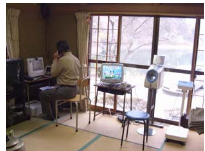
奥多摩町 生活館における運用状況